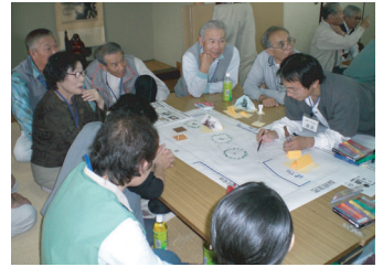
【ワークショップの様子】